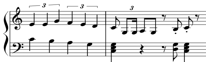
Lördan e svår: six over four . Söndan e ledig! God natt!