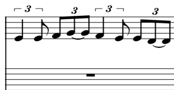
Lördan e svår: six over four .

för att veta hur många kors och ben varje tonart har, om det inte är C